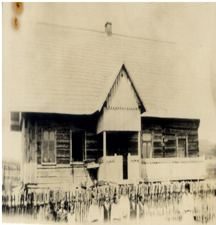
Zdj. Uczniowie 4-klasowej Szkoły Powszechnej w Rosochatem na tle szkoły. 27.05.1936r.