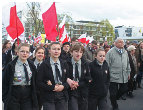
Bieszczadzka Drużyna Bartoszowa w kondukcje żałobnym