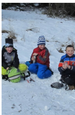
„Rysie” podczas wyprawy 06.02.br.