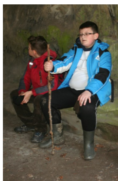
Uczniowie naszej szkoły w jaskini