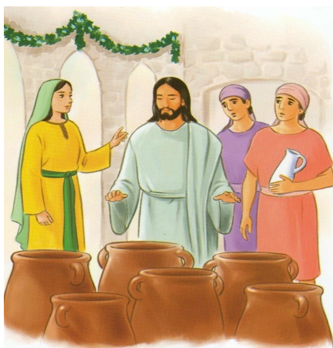
2. Cud na weselu w Kanie G.

Panie Jezu, Ty na weselu w Kanie Galilejskiej pokazałeś, jak łatwo radość może zamienić się w smutek, a sytość – w głód. Bądź moim największym weselem, bo żyjesz i królujesz na wieki wieków. Amen.