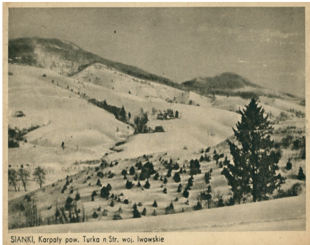
SIANKI, Karpaty pow. Turka n.Str. woj. lwowskie

Urządzona dwudniowa wycieczka 4 i 5 stycznia 1938 na Pikuj w zupełności spełniła swoje zadanie, podnosząc przez